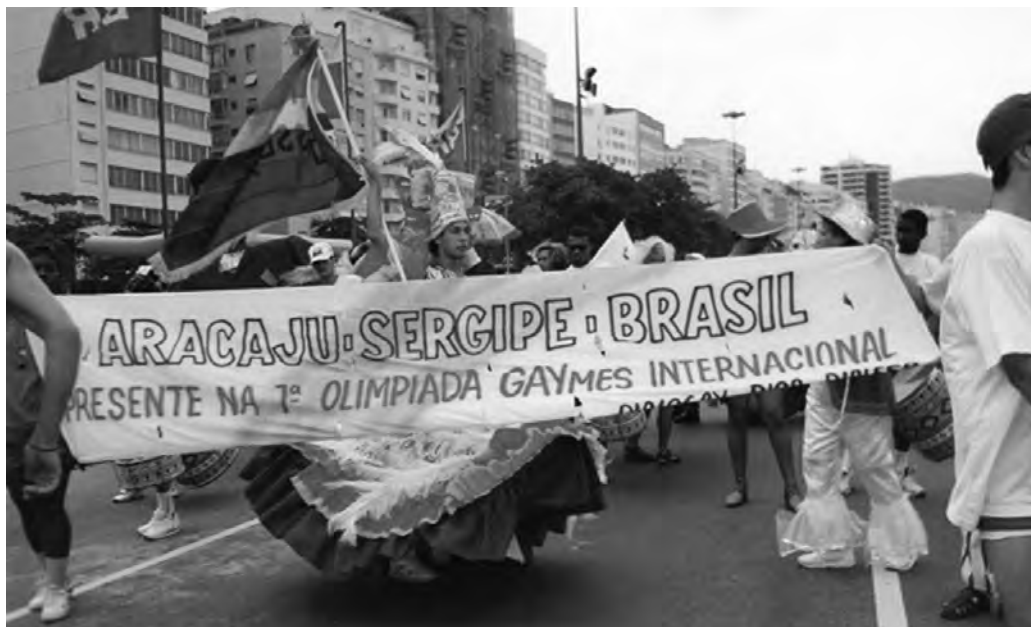
Marcha pela Cidadania Plena de Gays e Lésbicas, Av. Atlântica, Copacabana, 25 jun. 1995.