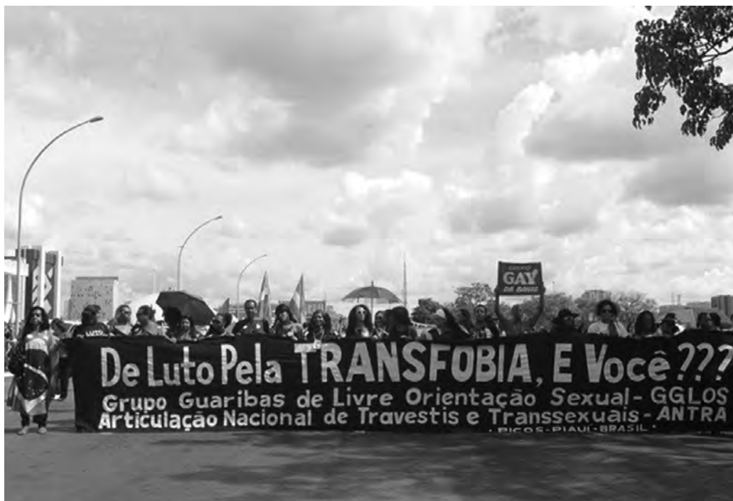
1 Marcha Nacional contra a homofobia, Brasília, 19 maio 2010.

atualmente, há duas organizações: a Associação de Travestis e Transexuais do Rio de Janeiro (Astra-Rio) e o Movimento de Gays, Travestis e Transformistas (MGTT), em Madureira.